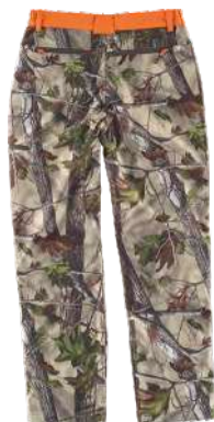
camuffamento bosco verde/arancio a.v.