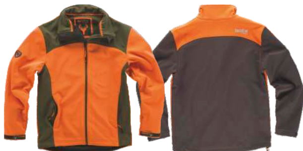
arancio a.v./verde caccia