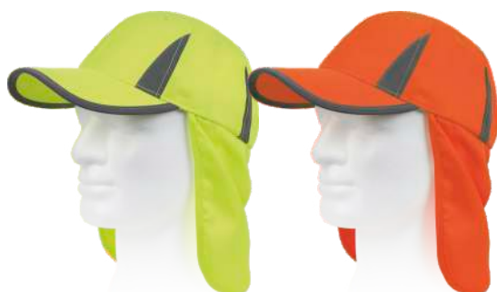
giallo a.v. arancio a.v.