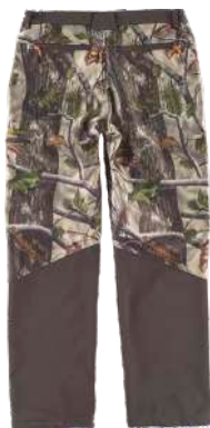
camuffamento bosco verde/marrone

Tessuto Secondario: 96% Poliestere 4% Elastan (300 g/m 2 )