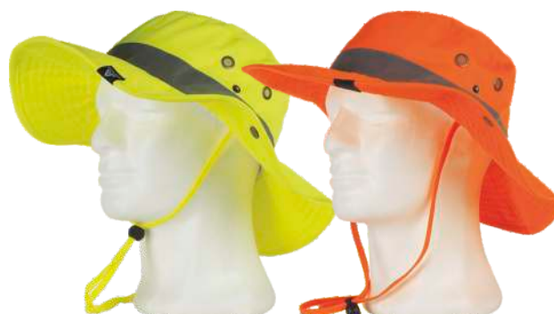
giallo a.v. arancio a.v.