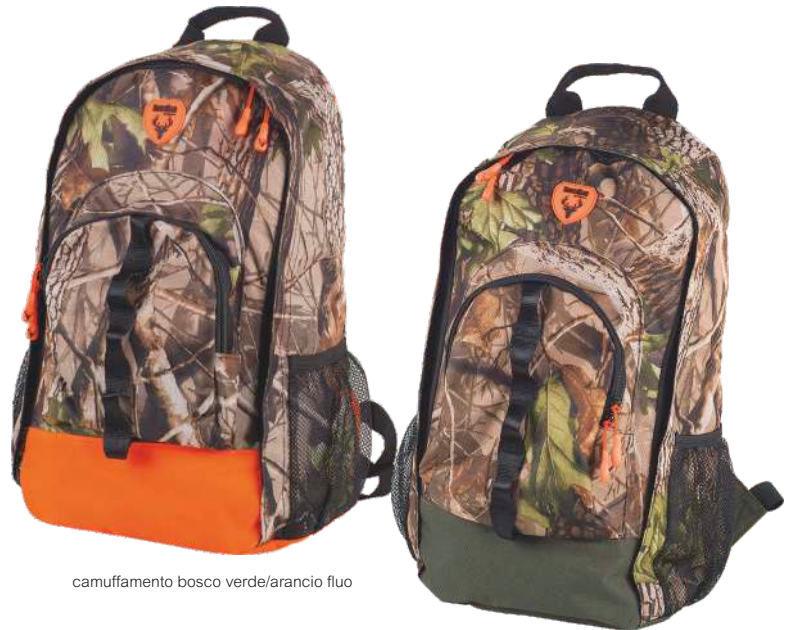
camuffamento bosco verde/arancio fluo