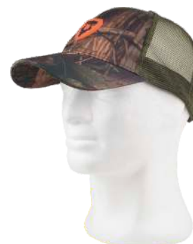
camuffamento bosco verde/verde caccia