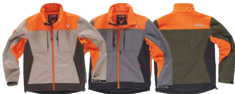
beige/marrone/arancio a.v. grigio/nero/arancio a.v. verde caccia/nero/arancio a.v.