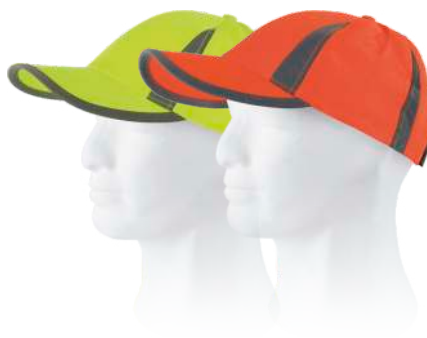
giallo a.v. arancio a.v.