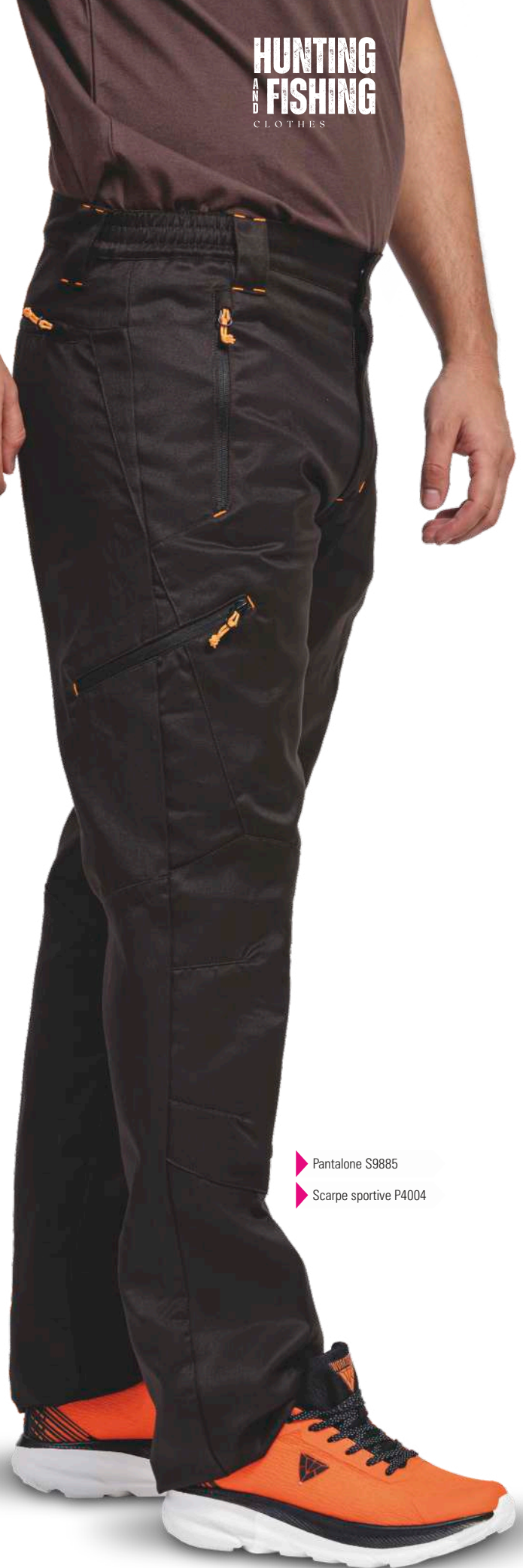
▶ Pantalone S9885