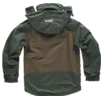
verde bosco/verde oliva