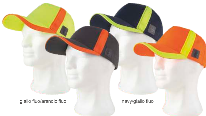
giallo fluo/arancio fluo