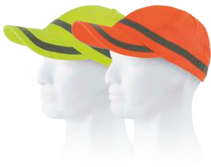
giallo a.v. arancio a.v.