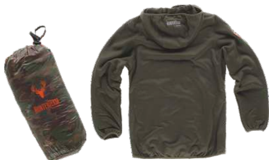
verde caccia/camuffamento marrone