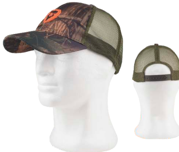
camuffamento bosco verde/verde caccia