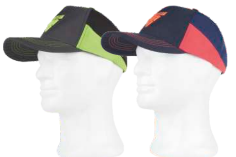
grigio scuro/nero/verde lime