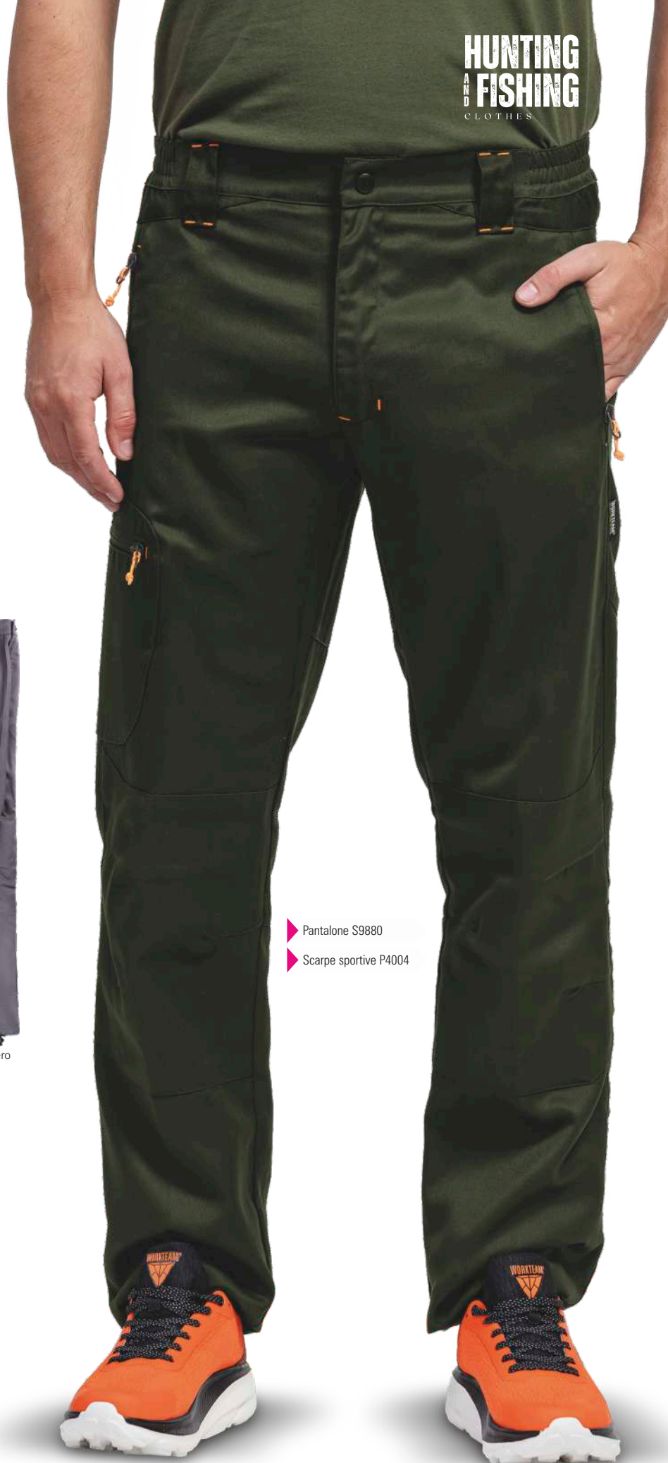
▶ Pantalone S9880