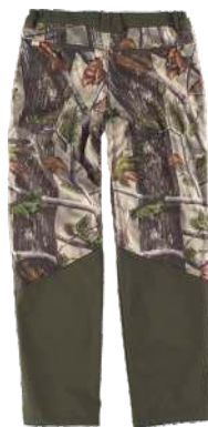
camuffamento bosco verde/verde caccia